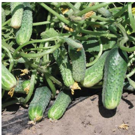
Ogórki partenokarpiczne, grubobrodawkowe, do uprawy polowej