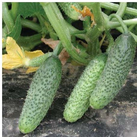
Ogórki partenokarpiczne, grubobrodawkowe, do uprawy polowej

*Pod warunkiem utrzymania plantacji w dobrej kondycji