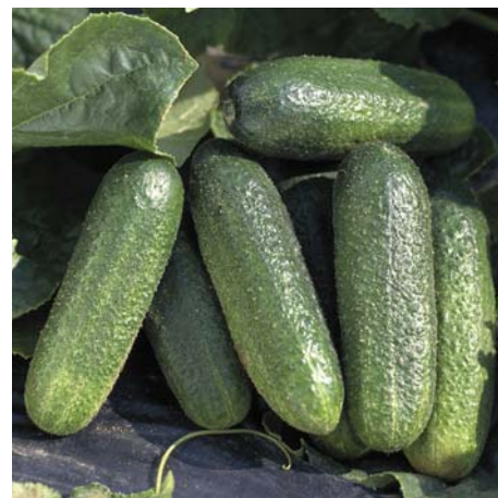
Ogórki partenokarpiczne, drobnobrodawkowe, do uprawy polowej

*Pod warunkiem utrzymania plantacji w dobrej kondycji