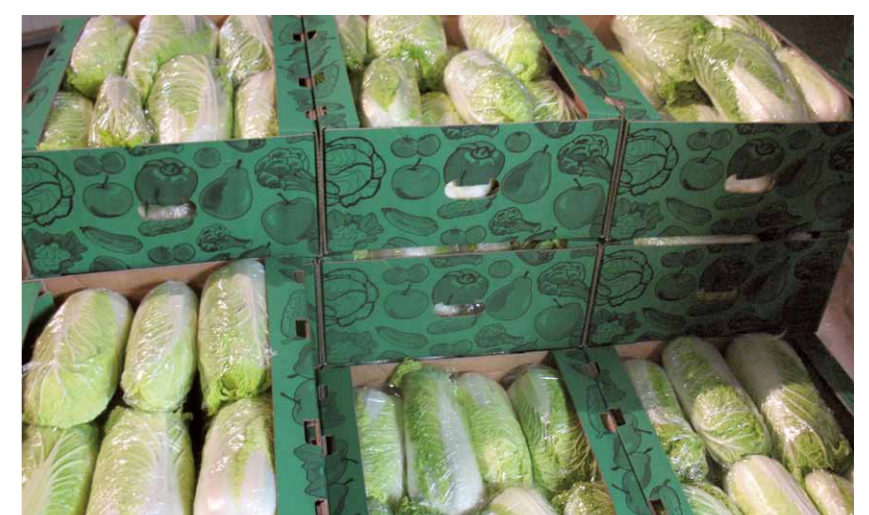
Małgorzata i Zbigniew Altawęgier

„...Suprin to zielony kolor liści i wysoka zdrowotność po przechowaniu. Dla mnie oznacza to niższe koszty przygotowania towaru oraz łatwiejszą jego sprzedaż w lepszej cenie. Dzięki możliwości zagęszczenia do 90 tys/ha uzyskuję wysoki udział najbardziej handlowych główek o wadze do 1,5 kg”