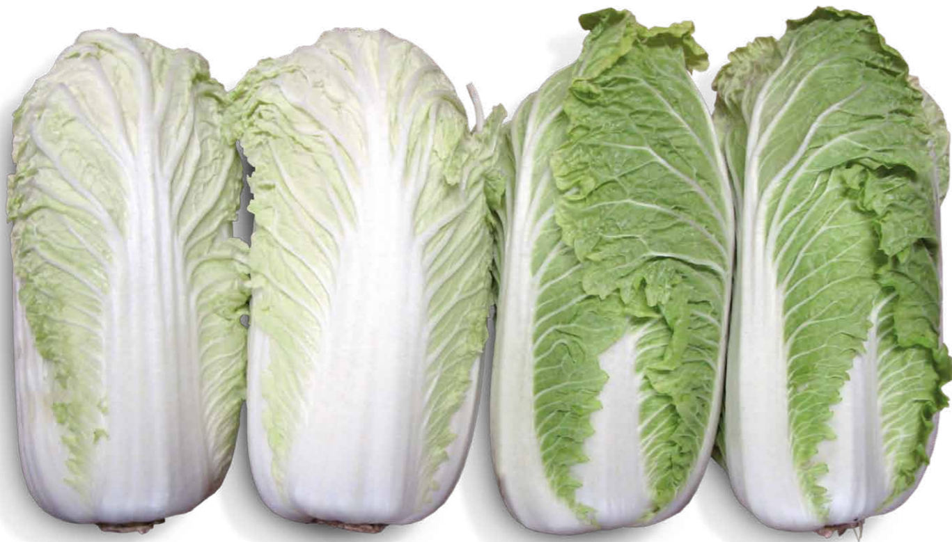
Główki odmiany standardowej (po lewej) i Suprina (po prawej) po przechowaniu

Kilka lat temu na rynku polskim pojawiła się nowa odmiana kapusty pekińskiej firmy Syngenta Seeds – Suprin. Dziś już śmiało możemy powiedzieć, że staje się ona nowym standardem w uprawach tego warzywa z przeznaczeniem do przechowania. Suprin jest najchętniej wybierany spośród nowych odmian zarówno przez producentów, jak i handlowców. Zdecydowały o tym takie zalety jak: intensywnie zielony kolor po przechowaniu, niewielkie straty związane z przechowaniem oraz niższa podatność odmiany na przechowalnicze choroby fizjologiczne.